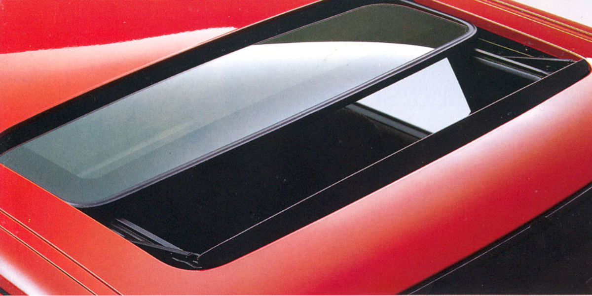
Toit ouvrant à commande électrique en option