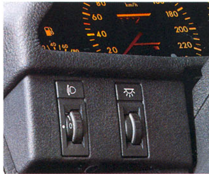
Correcteur intérieur du site des projecteurs