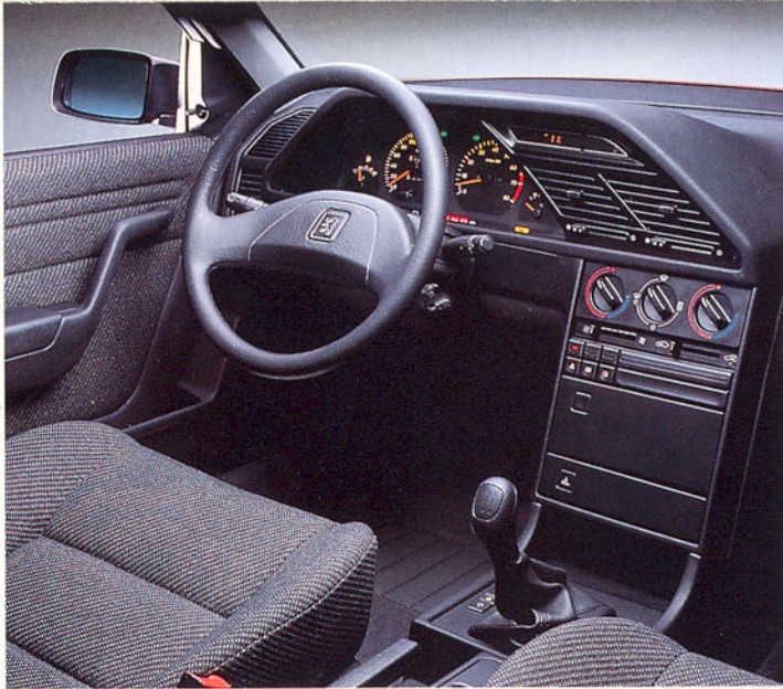
Poste de conduite