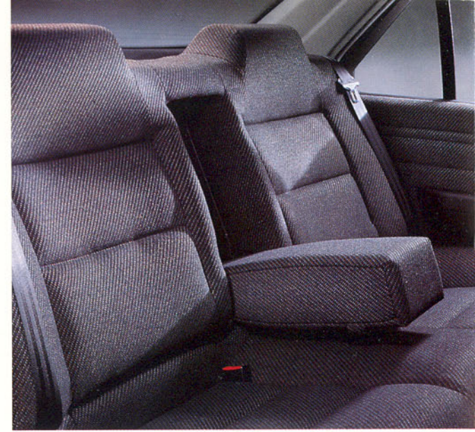
Accoudoir central arrière escamotable et trappe à skis