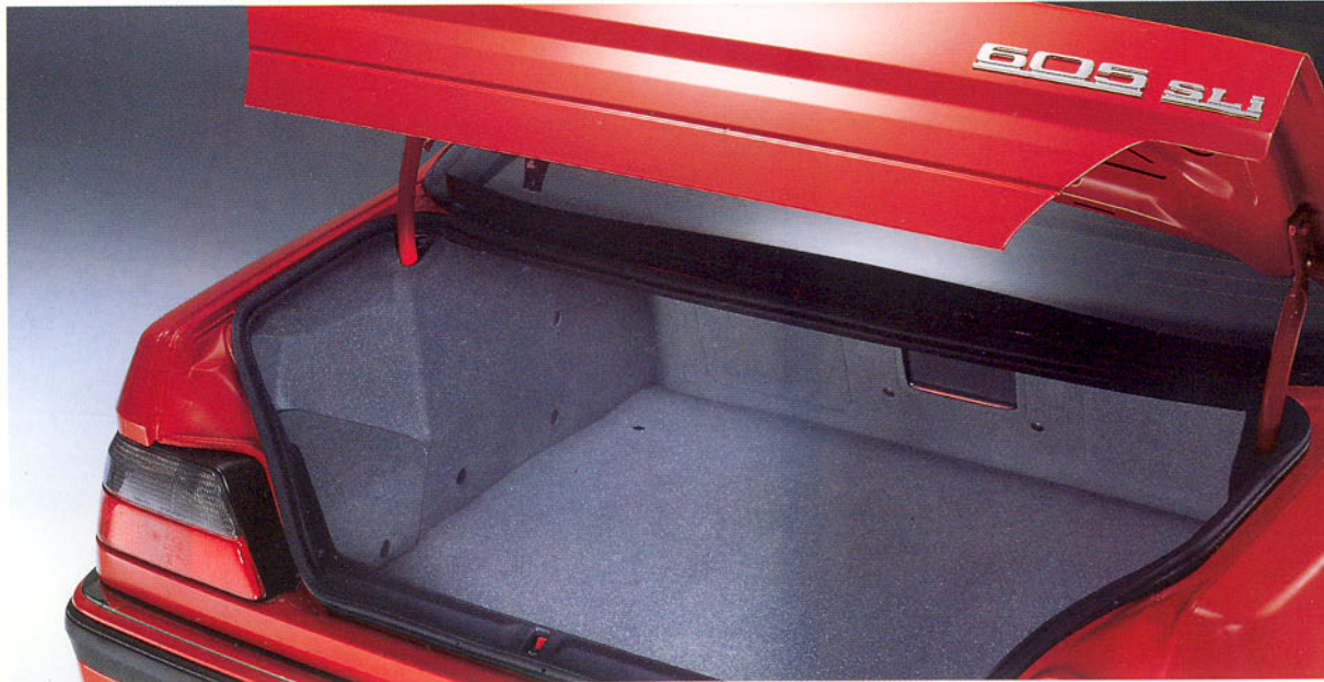
Coffre garni de moquette, avec éclairage