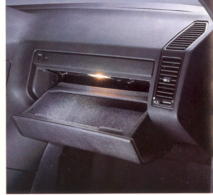
Boîte à gants éclairée et verrouillable